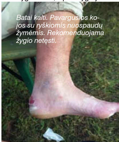
Batai kalti. Pavargusios kojos su ryškiomis nuospaudų žymėmis. Rekomenduojama žygio netęsti.