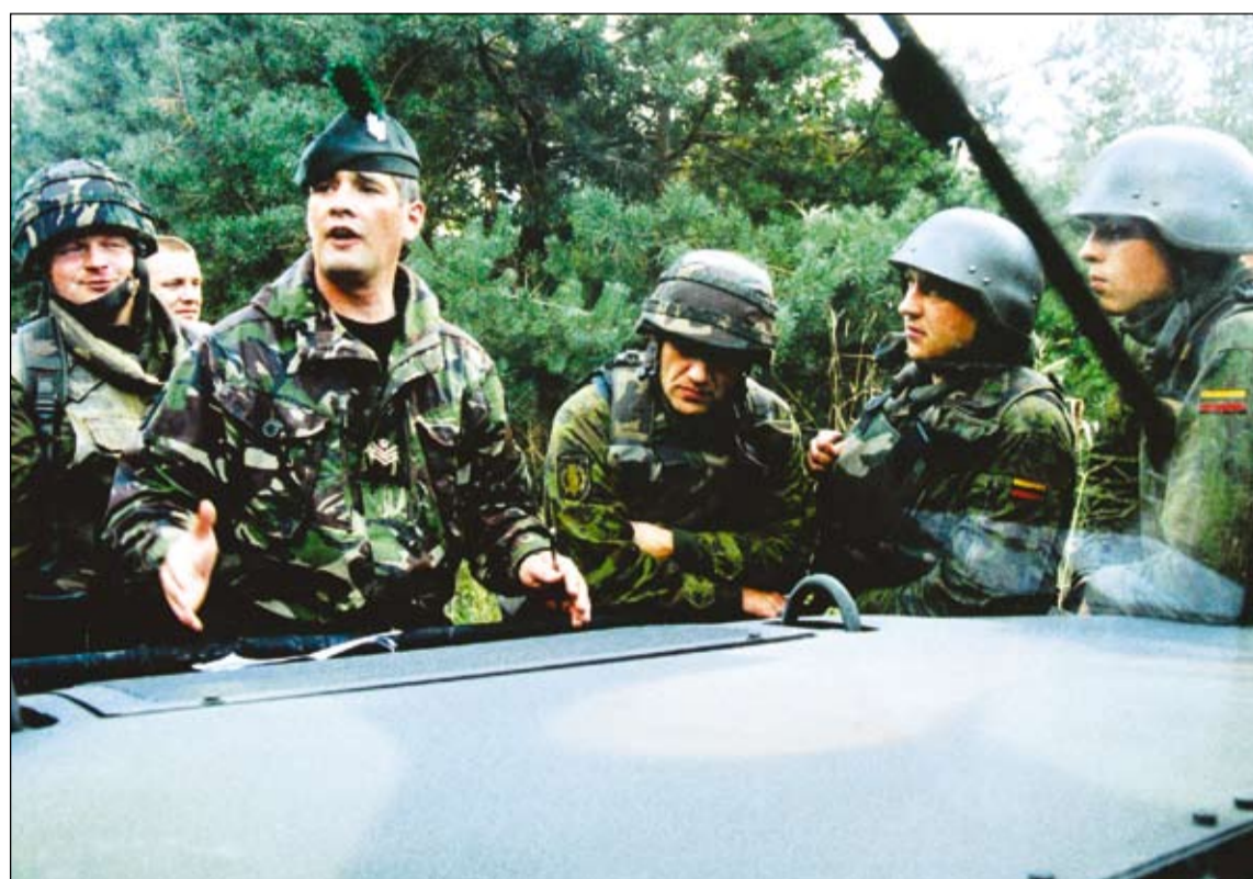
J. psk. Bretas Edas su kursų dalyviais dalijosi gausia patirtimi.