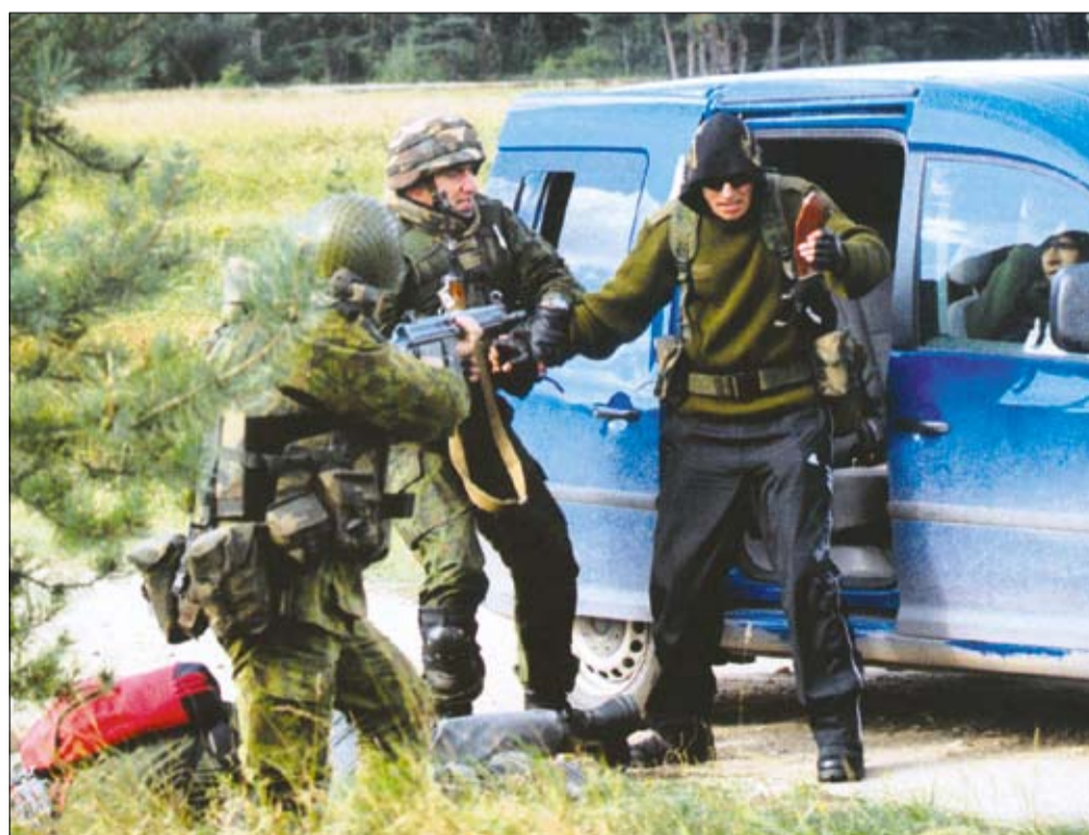
Pratybose dalyvavo kariai iš Savanorių pajėgų „Geležinio Vilko“ brigados, kitų dalinių. Kursas šiemet buvo orientuotas į užduotis, vykdomas Afganistane.