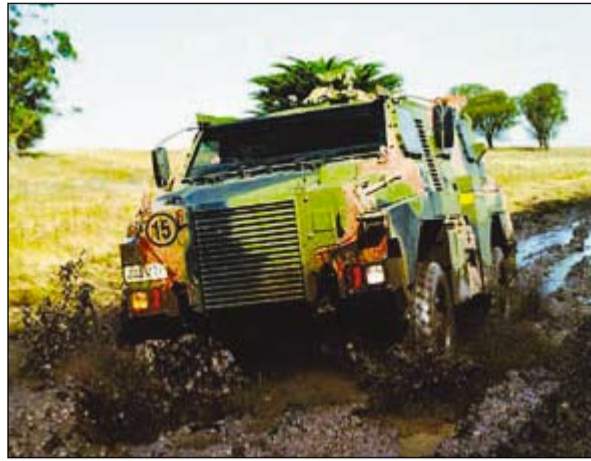
Australija savo reikmėms sukūrė šarvuotą automobilį „Bushmaster“.