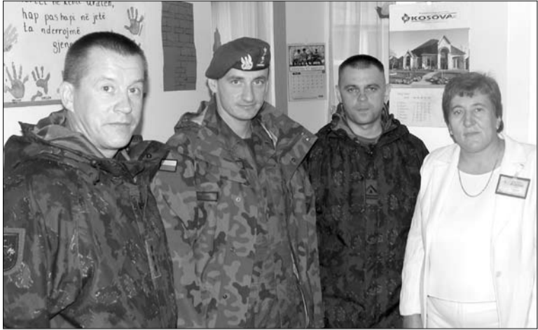
Lietuvių ir lenkų atstovai albanų vaikų darželyje. KFOR-16 nuotrauka