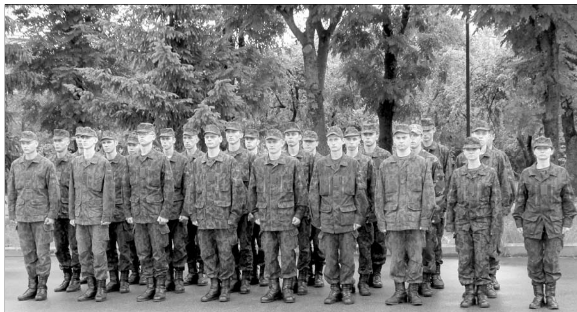
Vasarą Telšiuose prisiekė beveik šimtas savanorių.

Antrąjį Bazinio kurso etapą kariai savanoriai išeis, kaip ir įprasta – Dragūnų mokomajame batalione, Klaipėdoje.