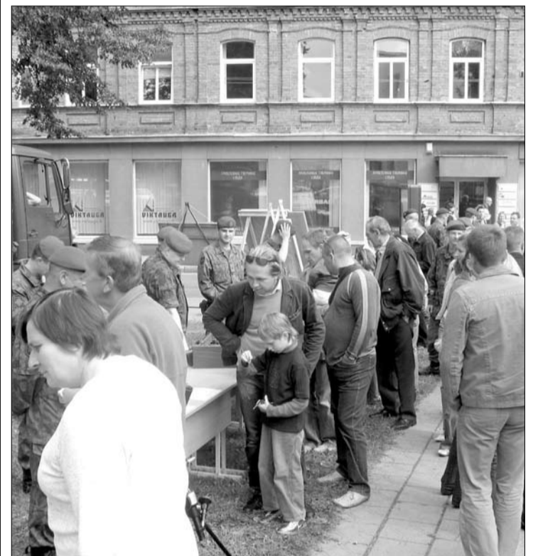
Savanoriai Panevėžio centre.

Vyčio rinktinės kariai demonstravo ginkluotę, dalijo lankstinukus, miestiečiams pristatė standus su informacija apie Savanorių tarnybą. Jaunoji panevėžiečių karta gausiausiai būriavosi prie ginklų parodos, klausinėjo karių apie turimą ginkluotę, tarnybos ypatumus, kasdieninę veiklą. Visus besidominčius supažindinę su Vyčio rinktinės veikla, kariai kvietė prisijungti prie jų ir tapti kariais savanoriais.