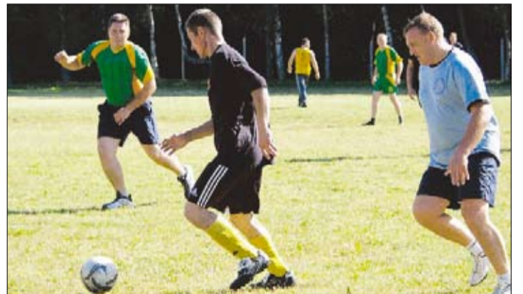
Draugiškų varžybų akimirka.