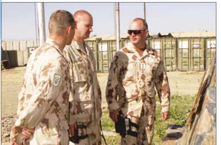
PAG-4 ir PAG-5 vadovybė prie ką tik pašventinto paminklo.