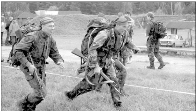
Lietuviai iškovojo garbingą 5-ąją vietą.